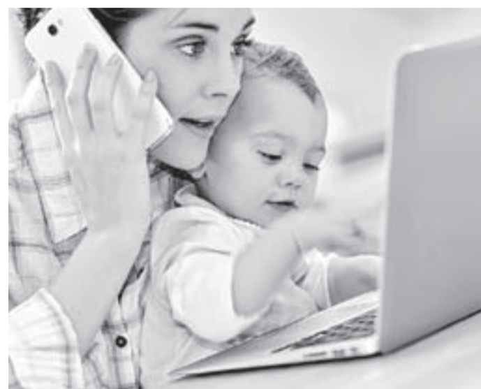
Gyerekevelés és munka - együtt nem egyszerű